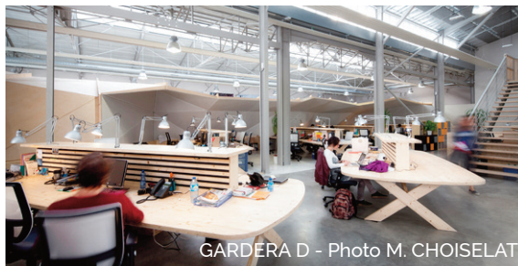
GARDERA D