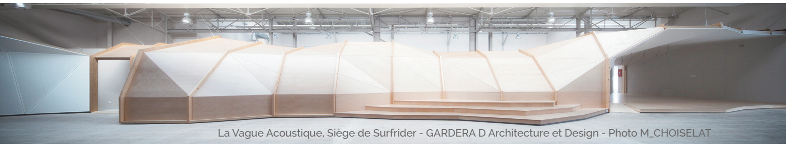
La Vague Acoustique, Siège de Surfrider - GARDERA D Architecture et Design