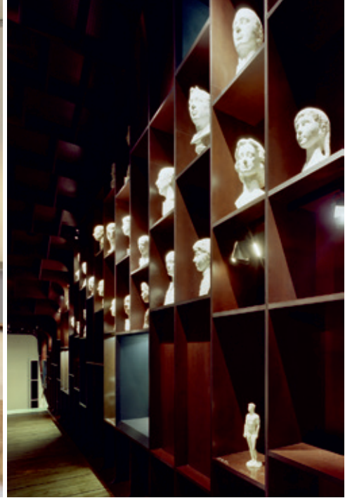
© R. Meffre et Y. Marchand