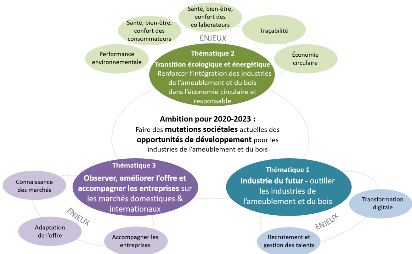
Schéma récapitulatif du Contrat de performance 2020-2023 du CODIFAB

Les enjeux clés sont présentés dans le schéma ci-dessous.